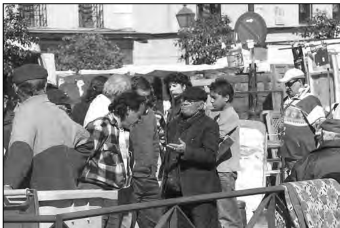
Fotografer: Sidan 9, medurs uppifrån. Loppmarknad i Bryssel, foto sblackley / Flickr. Port D'Orleans i Frankrike. Foto zehavk / Flickr. Oviedo, Spanien. Tomás Fano / Flickr. Till vänster: Förhandlaren. Foto Mike_eIMadrileño / Flickr. www.flickr.com

Tingen kan bli en inkörsport till minnen och nostalgi. Det är inte längre ens högsta önskan att få en blunddocka, men det var