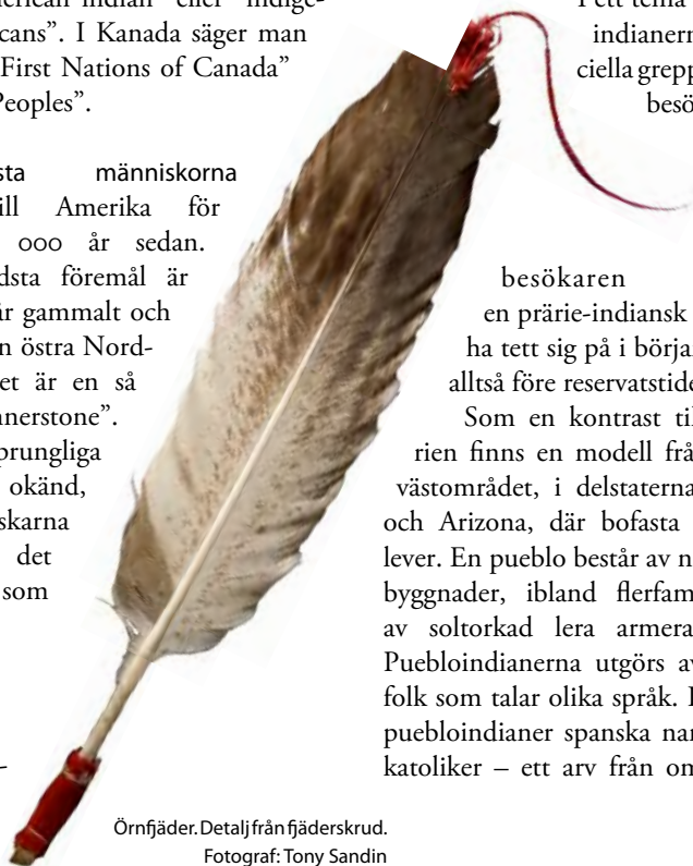
Örnfjäder. Detalj från fjäderskrud.

Som en kontrast till livet på prarien finns en modell från en by i sydvästområdet, i delstaterna New Mexiko och Arizona, där bofasta puebloindianer lever. En pueblo består av närliggande fasta byggnader, ibland flerfamiljshus byggda av saltorkad lera armerad med halm. Puebloindianerna utgörs av olika indianfolk som talar olika språk. Idag har många puebloindianer spanska namn och är ofta katoliker – ett arv från områdets spansk-