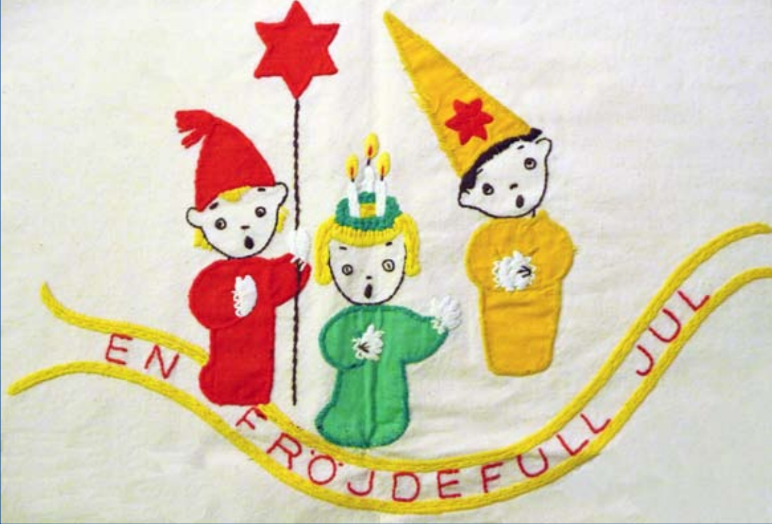
Detalj av bordsduk av bomull med applikationssömnad och broderade detaljer.