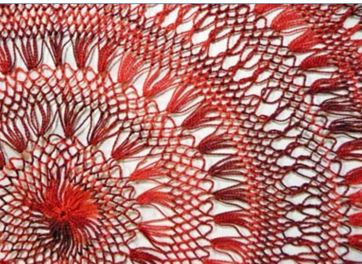
Gaffelvirkt bordsduk av konstfärgat yllegarn, med hjälp av en tvåtdig trågaffel och virknål. Cirka 36 cm. Sverige slutet av 1900-talet.

Även det textila hantverket har funnit en ny roll. ”Hemslöjd, konsthantverk och konstindustri har blivit manifestationer av och för det goda livet”, konstaterar designkritikern Ulf Hård af Segerstad i sin