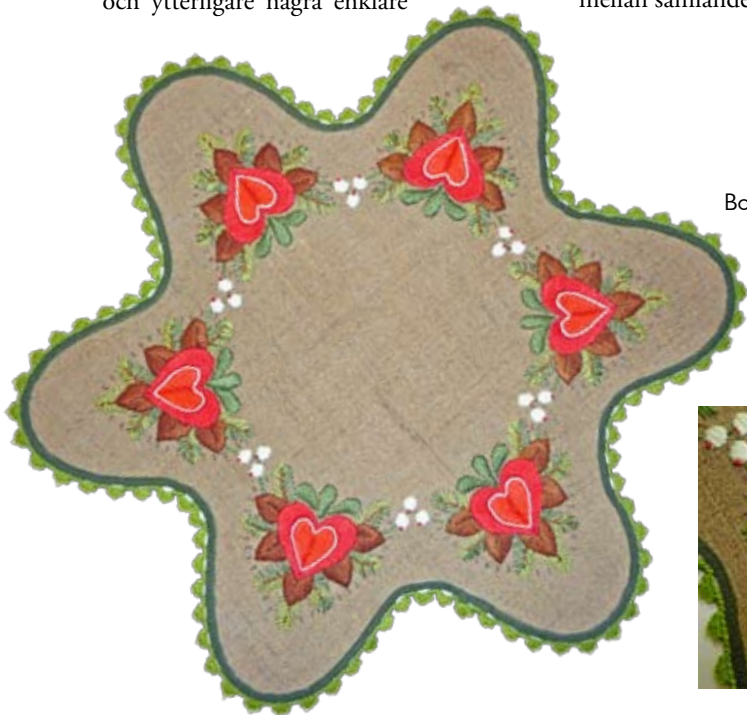
Bordsduk av grovt, naturfärgat lin med broderade julmotiv i konstfärgat yllegarn, med inköpt maskinvävd, påsydd kant. Cirka 50 cm. Tyskland 1970-tal.

Hemslöjdskonsulenter i Sverige spelar idag en viktig roll genom att samla gamla kunskaper kring samlingar på museer och hos privata samlare för att förmedla resultaten till den intresserade allmänheten. De har som sitt kall att ständigt vidareutveckla tekniker och design för att anpassa dem till vår tid. Detta kan ske genom publicering i tidskrifter och nya böcker för skilda ämnen eller genom studiecirklar som har fått en allt större uppmärksamhet. Den viktigaste tidskriften i detta sammanhang är Hemslöjd – en värld av fantasi & kunskap som med sina temanummer är en viktig länk mellan samlande och nyproduktion.