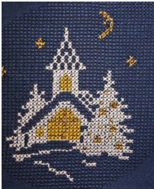
Bordduk av vävt linne med korsstygnbroderi, konstfärgat bomullsgarn, detalj cirka 10 cm. Tyskland 1990-talet.