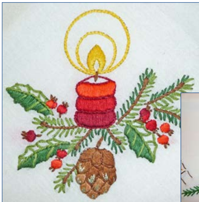
Detalj av bordsduk, bomullstyg med fyllnadsbroderat konstfärgat yllegarn och metalltrådar. Motivstorlek cirka 8 cm. Tyskland 1980-talet.